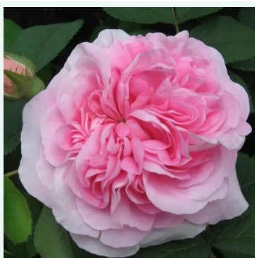
Königin von Dänemark

roze - historische, damaskroos 140-200 cm zeer sterk geurende, van veraf waarneembare roos - parfumachtig, rozenachtig