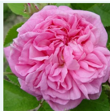
La Ville de Bruxelles

roze - historische, alba-roos 120-180 cm zeer sterk, de tuin vullende geur roos - vol, klassiek rozenaroma James Booth