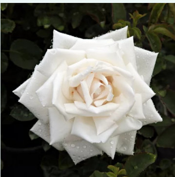
Frau Karl Druschki