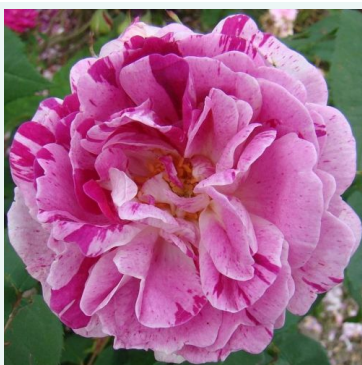
Honorine de Brabant

roze - historische roos, bourbonroos 150-220 cm sterk, markant geurende roos - zoet, fruitig-roosachtig karakter Hyacinthe Rémi Tanne